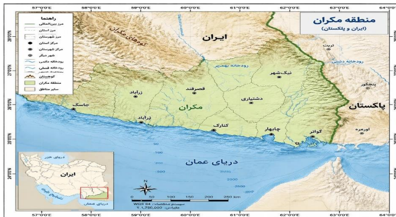
شکل ۲. محدوده مورد مطالعه (مکران)

کشاورزی گرمسیری (مانند موز و انبه) استوار است. ویژگی‌های جمعیتی و اجتماعی جمعیت منطقه بین ۱.۵ تا ۲ میلیون نفر تخمین زده می‌شود که بخش زیادی از آن‌ها در روستاها و سکونتگاه‌های کوچک زندگی می‌کنند. ساکنان عمدتاً از قوم بلوچ، پیرو مذهب اهل سنت (حنفی) بوده و به زبان‌های بلوچی و فارسی تکلم می‌کنند. این منطقه دارای نرخ رشد جمعیت نسبتاً بالا و ساختار جمعیتی جوان است (شکل ۲).